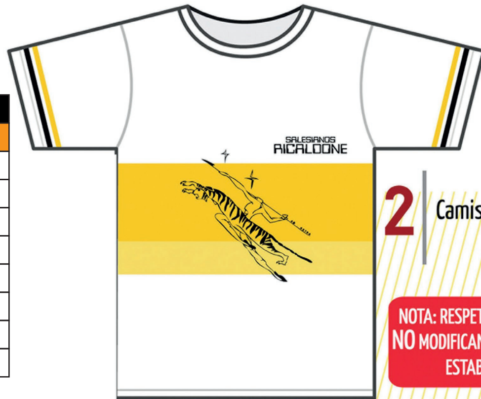
2 Camiseta Sport

NOTA: RESPETAR EL UNIFORME NO MODIFICANDO LOS MODELOS ESTABLECIDOS.