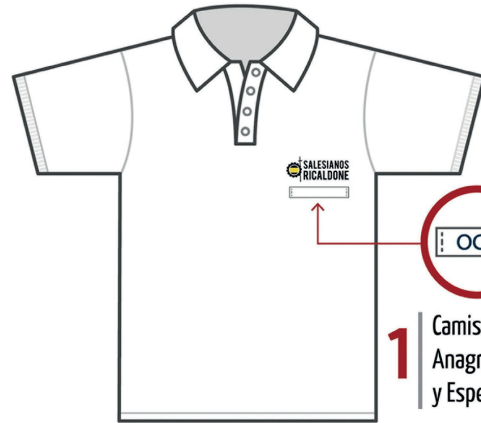
1 Camisa Tipo Polo Anagrama de Año y Especialidad